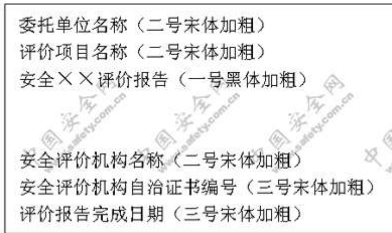
图 D . 1 封面式样